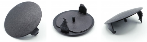
Blech, Platte / Sheet, Panel

Lochblendstopfen für unterschiedliche Wandstärken und Durchmesser Round covering inserts for various thicknesses of wall and diameter